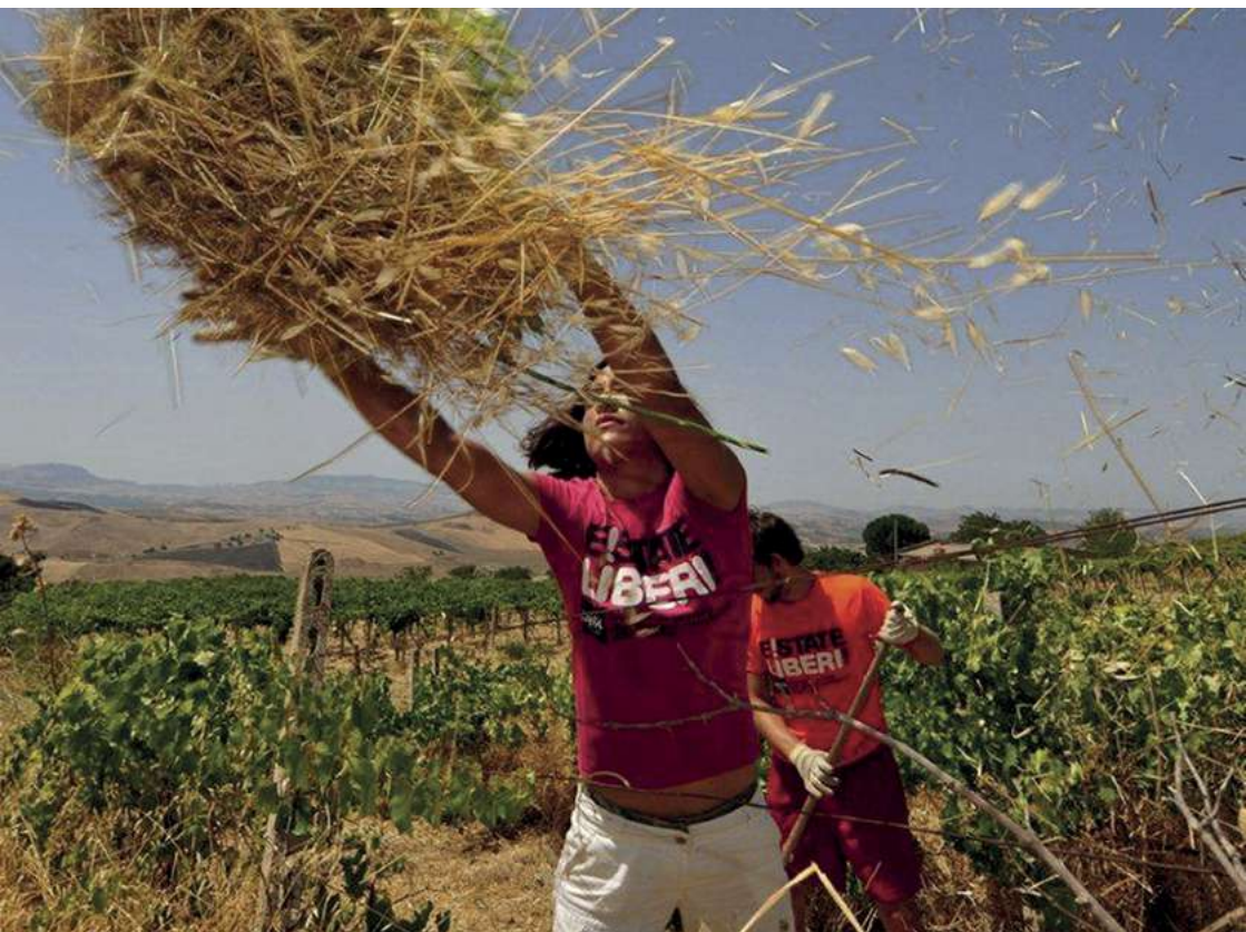
© LIBERA, Association noms et chiffres contre les mafias