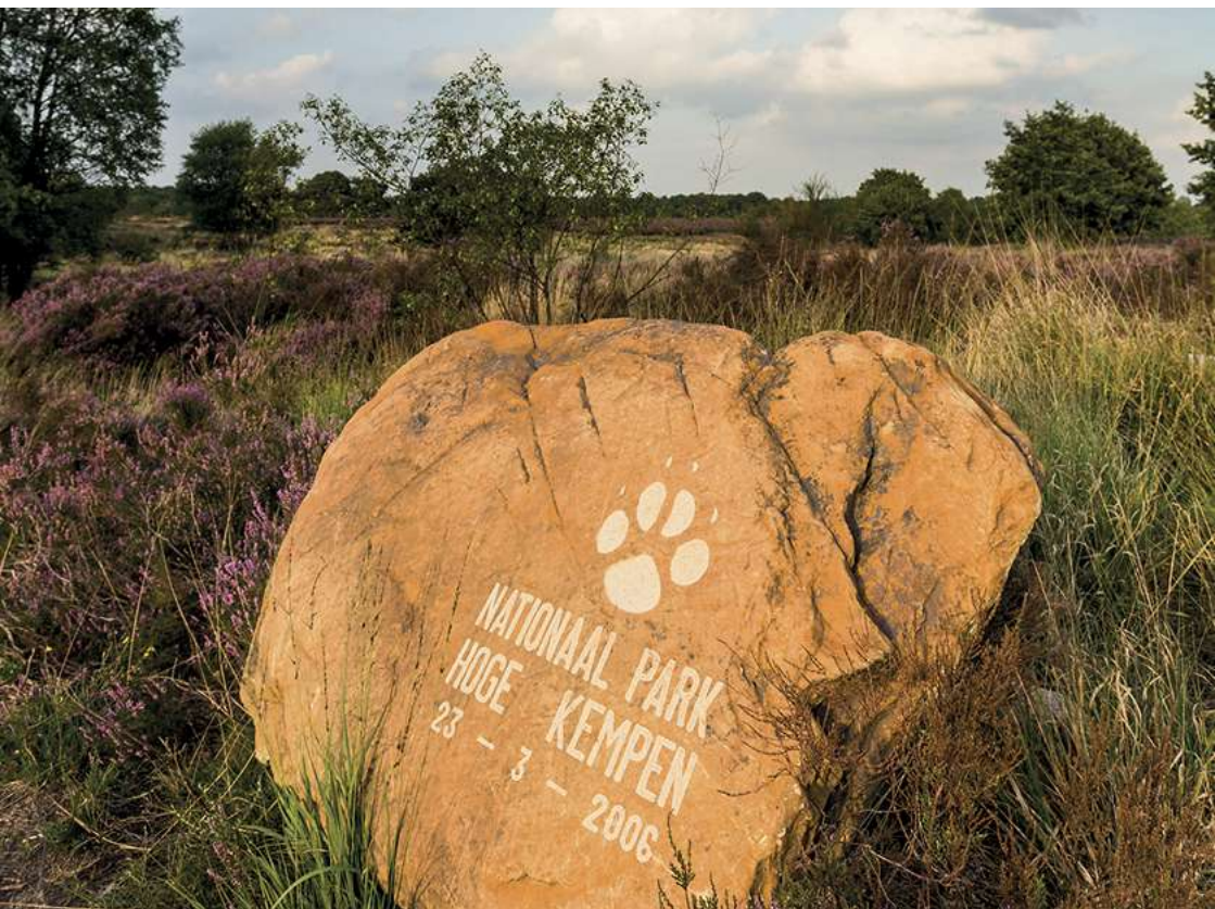
© Paysage régional Kempen en Maasland asbl