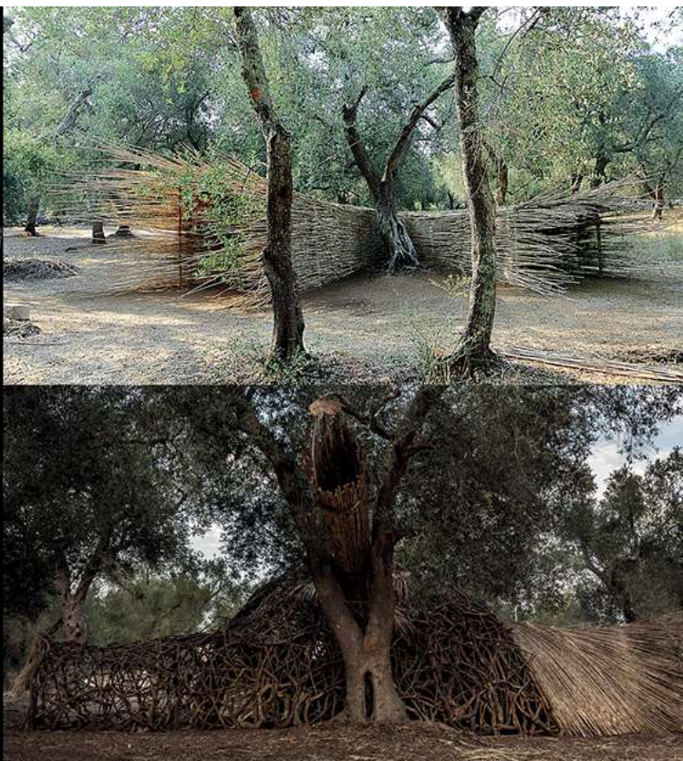
© «Lovo» – studio écru, «il Nido» – LUA, «La Tana» – Yacine Benseddik